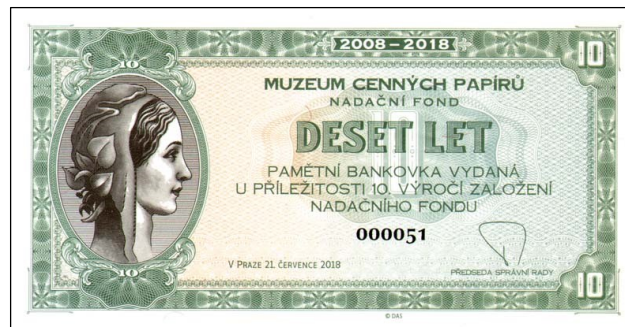
Pamětní bankovka k 10. výročí MCP vydaná 21. července 2018

To zdaleka není vše, co v letošním roce na veletrhu Sběratel uvidíte. Na stánku MCP (č.215) si můžete limitované emise šeků a pamětních bankovek zakoupit, ale v pátek 7. září 2018 v 16.30 hod. proběhne na našem stánku autogramiáda jejich autora, slovenského grafika Mateje Gábríše, který je mj. autorem i nové testovací bankovky nula EUR.